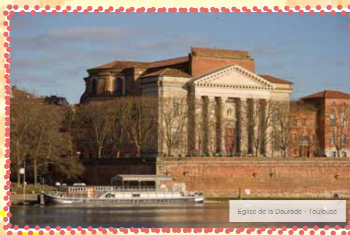
Eglise de la Daurade - Toulouse