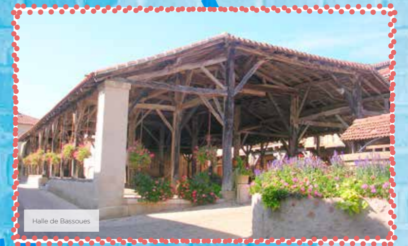
Halle de Bassoues

Nous voilà au XVIII e siècle et la visite d'Auch s'impose. Il y a bien entendu des vestiges plus anciens (la ville basse s'est développée sur un site gallo-romain) mais la ville haute est riche en édifices de cette époque : l'ancien palais épiscopal, où se trouve actuellement la préfecture, l'ancien couvent des Jacobins, actuellement musée des Jacobins, et l'Hôtel de Ville qui abrite un théâtre à l'italienne et sa salle des Illustres.