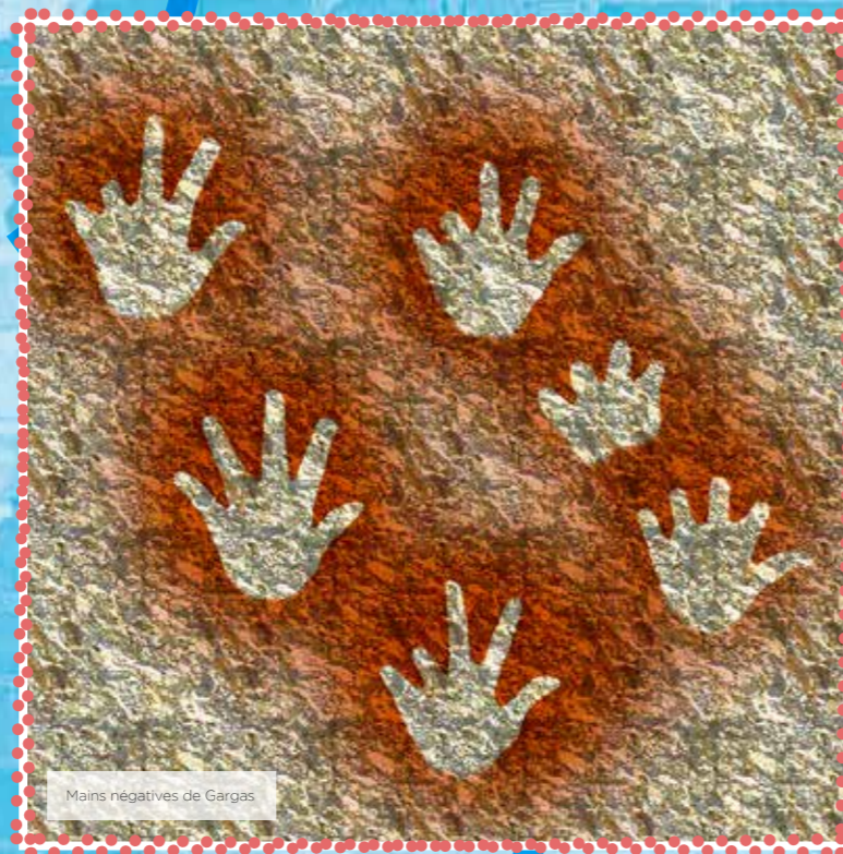
Mains négatives de Gargas

Le château de Busca-Maniban est un très bel exemple de l'architecture du XVIII e siècle en Gascogne. Il est à douze kilomètres de Condom et en pleine terre d'Armagnac. Le point fort de son architecture est la salle dite « à l'italienne », qui occupe deux étages sous une voûte en « arc de cloître ». C'est un modèle réduit de la Salle des Illustres du Capitole de Toulouse, elle porte dans des cartouches sous corniches, des évocations des hommes illustres de la région.