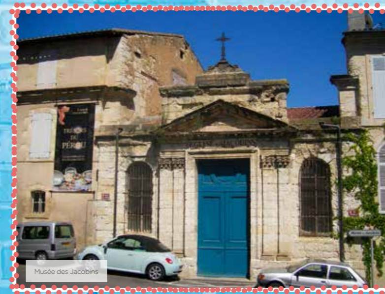
Musée des Jacobins