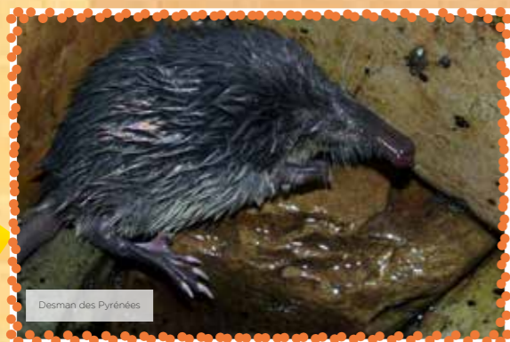
Desman des Pyrénées

L' Euprocte ( Euproctus asper ), gros triton endémique des Pyrénées, est contemporain de l'époque des dinosaures. Il vit dans les eaux froides des petits ruisseaux entre 1400 et 2600 m d'altitude. Il mesure de 10 à 16 cm ; sa peau est rugueuse, hérissée de pointes noires cornées. Les adultes ainsi que les grandes larves se nourrissent de larves de mouches, de moustiques et d'éphémères. Ils consomment également des têtards de grenouilles rouges. Les larves se nourrissent de petits crustacés. Il est classé parmi les espèces rares ou quasi menacées.