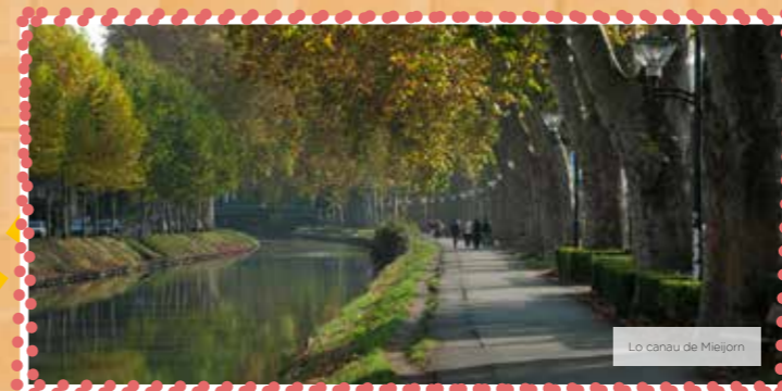
Lo canau de Mieijorn

Auèi, lo canau deu Mieijorn n'a pas mes la sua utilitat comerciala mès demòra un atot tau torisme e un ligam dens la grana region batiada d'ara en avant Occitania.