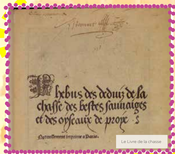
Le Livre de la chasse

Ce livre est un manuscrit, Gaston Fébus en dicta le texte à un copiste. Il est composé d'un prologue, de sept chapitres et d'un épilogue. Il est richement illustré d'enluminures et de compositions peintes, également appelées histoires.