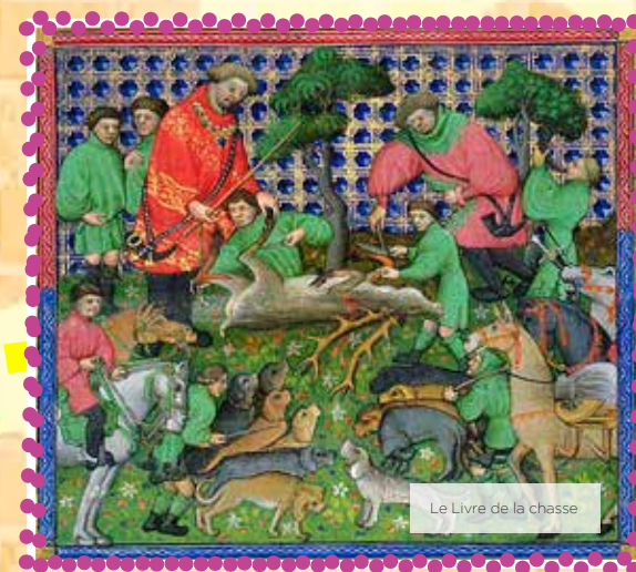
Le Livre de la chasse