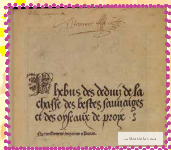
Lo libe de la caça

Entrepengoc de redigir, entre 1387 e 1391, un tractat sus l'art de la caça. Dediquèc aqueth libe a Felip lo Hardit, Duc de Borgonha. Aqueth tractat estoc utilizat peus adèptes de l'art cinegetic dinc a la fin deu sègle XVIau, e lo son succès estoc relançat gràcia a las debutas de l'imprimeria. Serà enquèra utilizat a la debuta deu sègle XVIIIau.